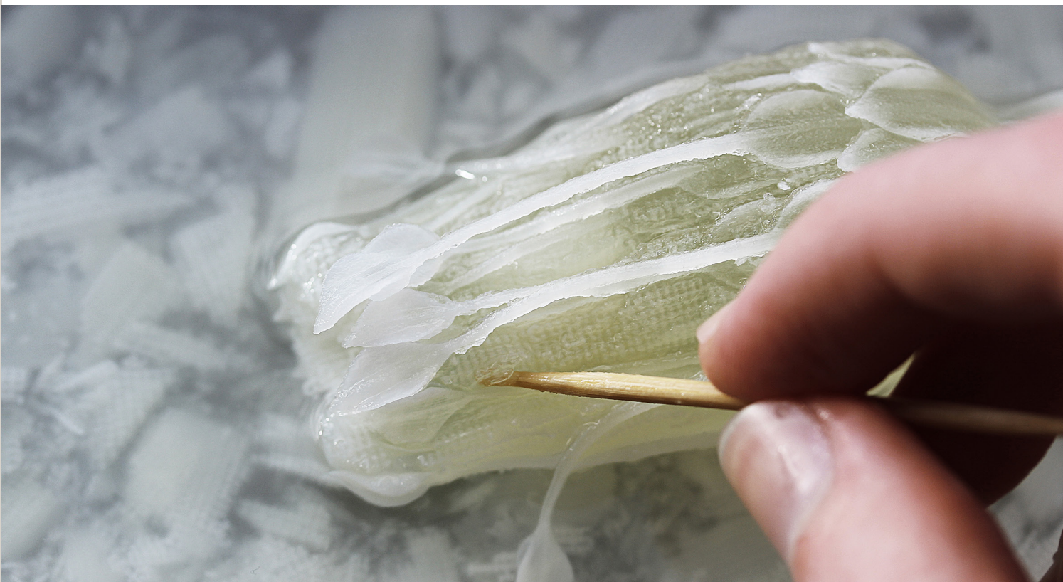
Progetto Hydrophytes 2018 - Pulizia manuale del materiale di supporto

Clicca qui per vedere come la tecnologia di stampa 3D di Stratasys è stata integrata in questo progetto.