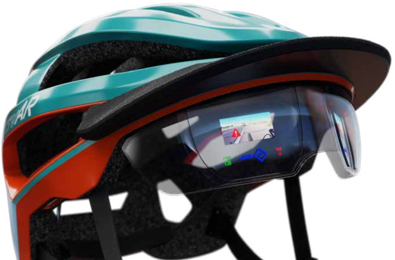
Modello di casco per bicicletta che incorpora una complessa tecnologia AR all'interno del visore trasparente, indicatori luminosi e texture dal design accattivante - Stampato in 3D da Thinkable Studio, utilizzando una J55

ufficio. Oggi, Thinkable Studio è in grado di realizzare prototipi che integrano in un'unica stampa cinque materiali diversi e quasi 500.000 colori con le opzioni di corrispondenza PANTONE®. Questi vantaggi sono evidenti in un recente progetto per la realizzazione di un casco per bicicletta dal design estremamente elaborato e con tecnologia AR integrata. Il concetto del design prevedeva l'inserimento di una complessa tecnologia AR all'interno del casco e del visore trasparente e l'utilizzo di indicatori luminosi e texture dal design accattivante. Utilizzando una J55 e il materiale VeroClear™, il team è stato in grado di stampare in 3D un visore trasparente molto realistico e con illuminazione a LED integrata. Secondo Schlieffers, senza le funzionalità di stampa 3D, il team non sarebbe mai riuscito a realizzare un modello 3D che risultasse quasi identico al prodotto finale.