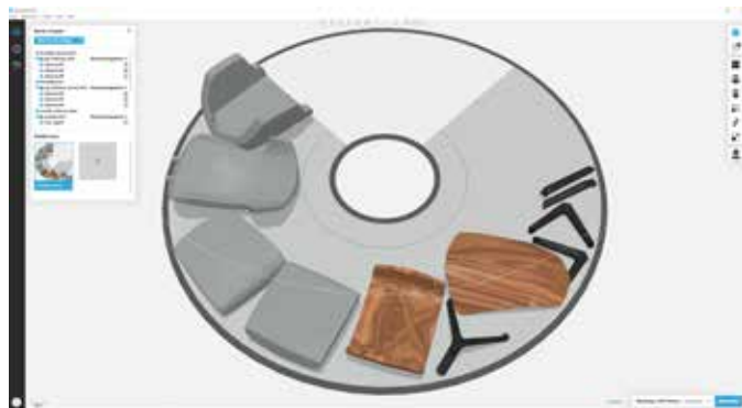
Modello di sedia progettato da Thinkable Studio, utilizzando il software GrabCAD Print. Qui mostrato sull'esclusiva piattaforma di stampa rotante di J55

“Si tratta di risparmi importanti che fanno un'enorme differenza per le prestazioni della nostra azienda e ci permettono di soddisfare le esigenze dei nostri clienti con la massima velocità. Inoltre, tutte le fasi, dalla progettazione alla stampa 3D, vengono svolte internamente e in questo modo possiamo garantire la riservatezza dei dati dei nostri clienti”.