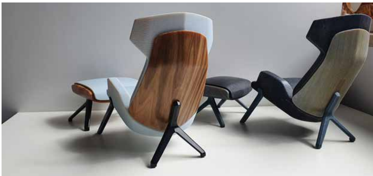
Modelli in scala di sedie, che replicano in modo accurato le texture di legno e pelle. Progettati da Thinkable Studio

Guardando al futuro, Thinkable Studio sta valutando di utilizzare la J55 per ampliare il proprio bacino di utenza e raggiungere nuovi settori come, ad esempio, l'industria del mobile. In quest'ottica, il team ha recentemente progettato e stampato in 3D un modello in scala di una sedia che riproduce con precisione le varie texture del legno e della pelle del progetto finale. Il team si è inoltre attivato per supportare al meglio le esigenze dei clienti nel settore sanitario. In questo caso, la stampante 3D viene utilizzata per ottimizzare la forma e la funzione dei nuovi prodotti medicali prima delle sperimentazioni cliniche.