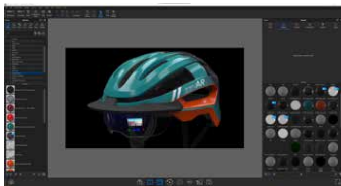
Progetto di casco per bicicletta realizzato da Thinkable Studio con il software di rendering 3D KeyShot 10