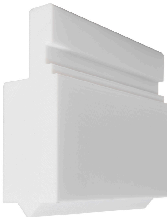
Un moule imprimé en 3D conçu pour produire un pliage en V. Le moule est actuellement utilisé dans l'atelier de production du client de Rolleri.

La société exploite également sa Fortus 380mc pour produire différents outils de fabrication destinés à augmenter le rendement de ses propres processus internes. Avant, le coût élevé de l'externalisation de nos moules empêchait la viabilité de la production d'outils en faible volume lorsque nous opérons avec des méthodes de fabrication traditionnelles. Cela obligeait les opérateurs à se débrouiller avec ce qu'ils avaient déjà sous la main. La polyvalence et la rentabilité de la Fortus 380mc ont surmonté ces contraintes et ont permis à Rolleri de créer des outils personnalisés à la demande. D'après M. Marzaroli, les outils utilisés pour produire la gamme de systèmes de serrage de la société constituent un bon exemple d'un tel avantage.