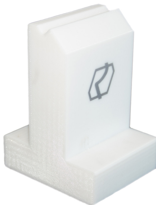
Une matrice imprimée en 3D utilisée pour des moules spécialisés qui éliminent le risque de marques disgracieuses sur les pièces en tôle.